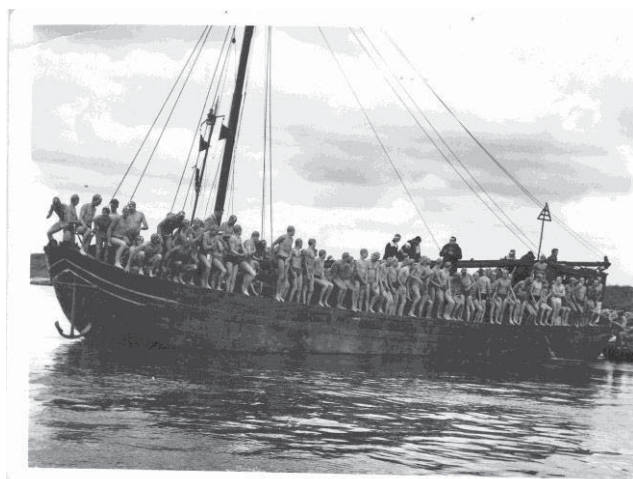
Rijntocht omstreeks 1960

Let op: Er is geen parkeergelegenheid voor auto's aan de zuidkant van de N225, dus ook niet bij de start en finish, ook niet voor bezoekers en publiek. Alleen mensen met een invalidenparkeerkaart worden met de auto doorgelaten.