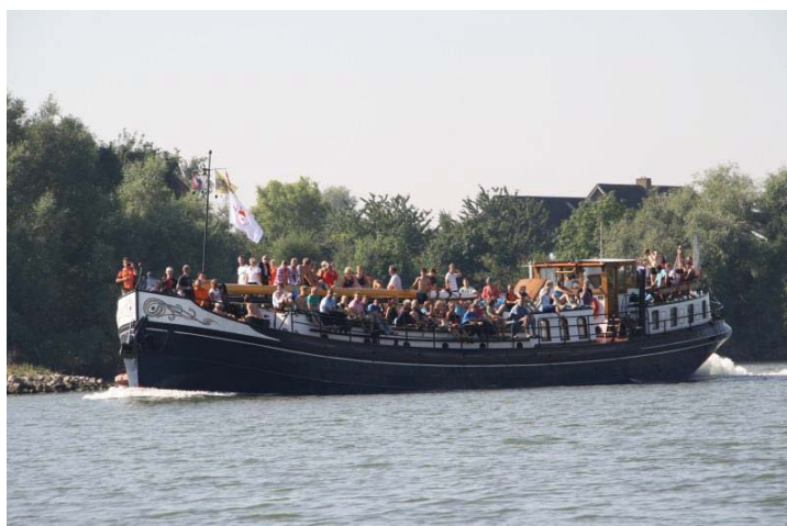
Rijntocht anno 2014